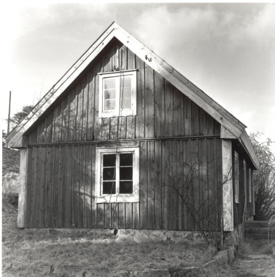
Fattigstugan i Elleholm. Bild från söder strax innan rivningen 1965.